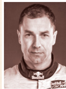
Martin Šonka, mistr světa letecké akrobacie letecké série Red Bull Air Race

Táborská setkání jsou pro mě slavnost, na kterou můžeme být pyšní. Bez tohoto festivalu si Tábor již ani nedokážu představit. Vždy se rád podívám na průvod v dobových kostýmech, ochutnám staročeskou kuchyni a podívám se na šermířské souboje. Pravidelně se jezdí zúčastnit přátelé z různých koutů Čech a také ze zahraničí.