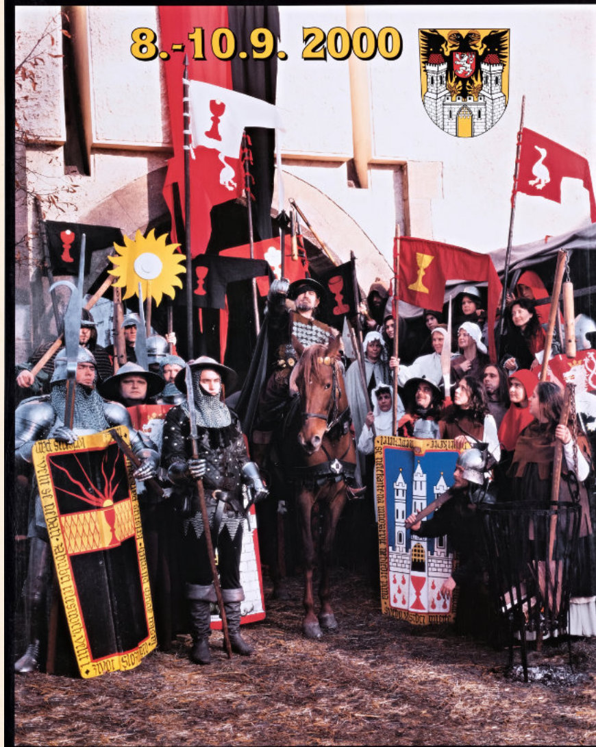
2.místo v soutěži propagačních materiálů „Tourpropag 2001“ v kategorii PLAKÁT – Táborská setkání 2000